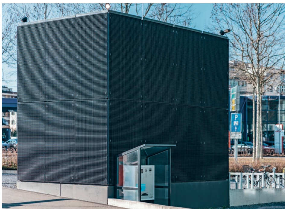
Vollroste setzen optische Akzente und bieten gegenüber Pressrosten einen erhöhten Sichtschutz.

Der Luftdurchlass bei Einhausungen ist von äus-