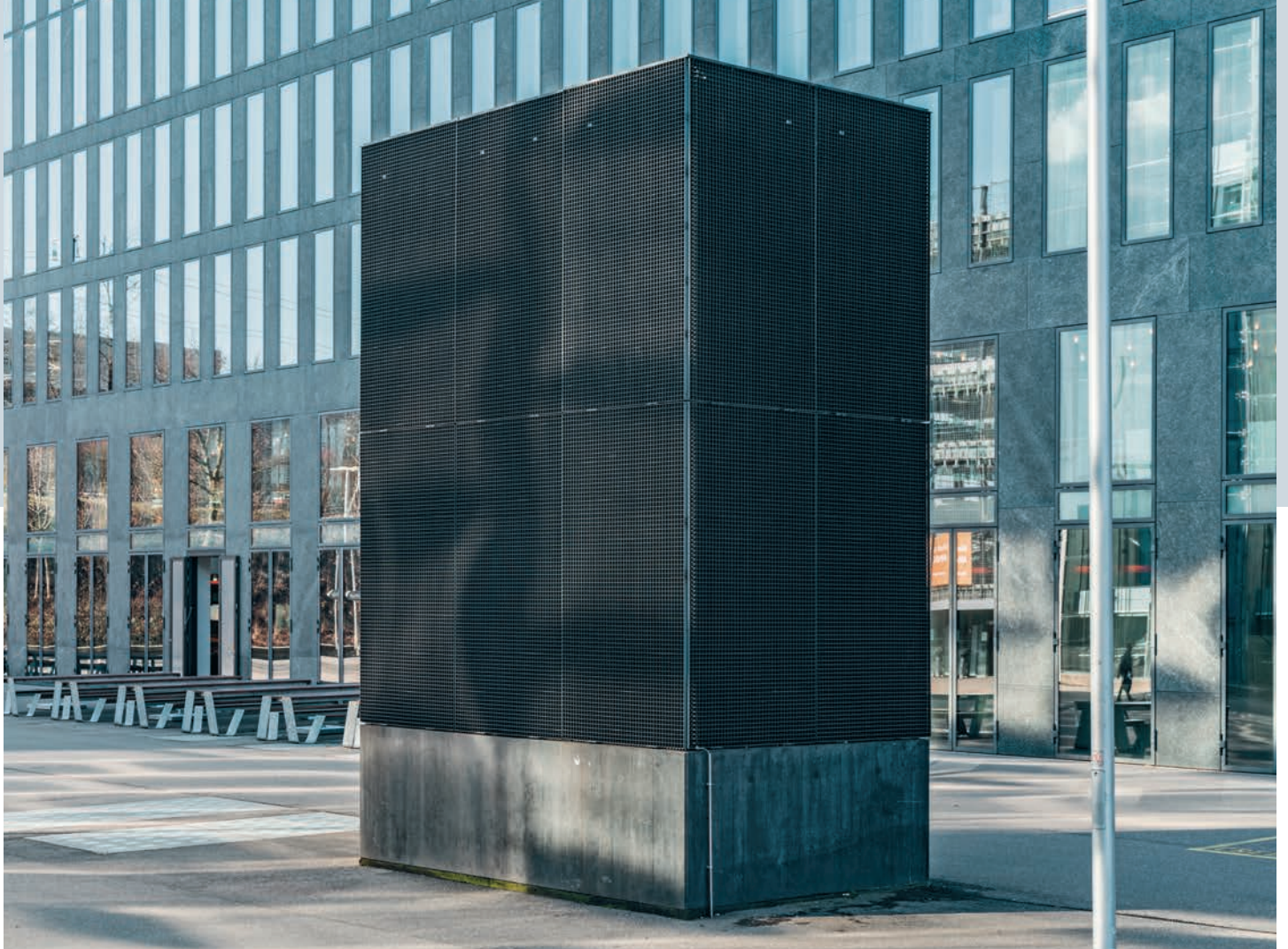
Die äusseren technischen Anlagen um die Sunrise Towers in Oerlikon sind mit Vollrosten eingekleidet.