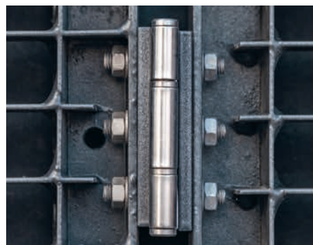
Anschraubbänder aus Edelstahl ermöglichen ein einfaches, bequemes Aufklappen einzelner Roste.

serster Wichtigkeit. Er garantiert technischen Anlagen genügend Frischluftzufuhr. Durch die Luftzufuhr überhitzen die Anlagen nicht. Ein weiterer essentieller Punkt ist, dass gerade Heizungs- oder Lüftungszentralen von der Frischluft abhängig sind - denn sie benötigen diese um damit die Gebäude zu heizen oder zu kühlen. Bei einer Maschenweite von 33,33 × 33,33 mm und einer minimalen Tragstab-/Querstabdicke von 2 mm erreichen die Einhausungen einen freien Lüftungsquerschnitt von über 86%. Die-